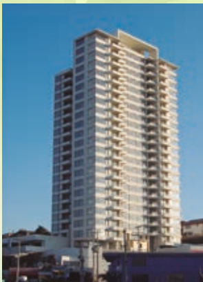
MAR VALLE ACONCAGUA