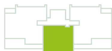
EMPLAZAMIENTO DEPTOS TIPO 2